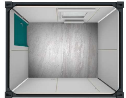
GI-Basic 10 Fuß