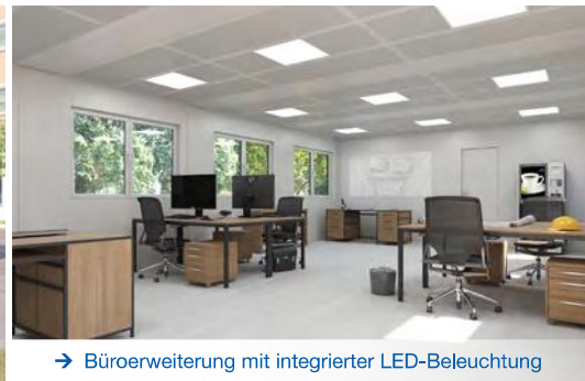
→ Büroerweiterung mit integrierter LED-Beleuchtung