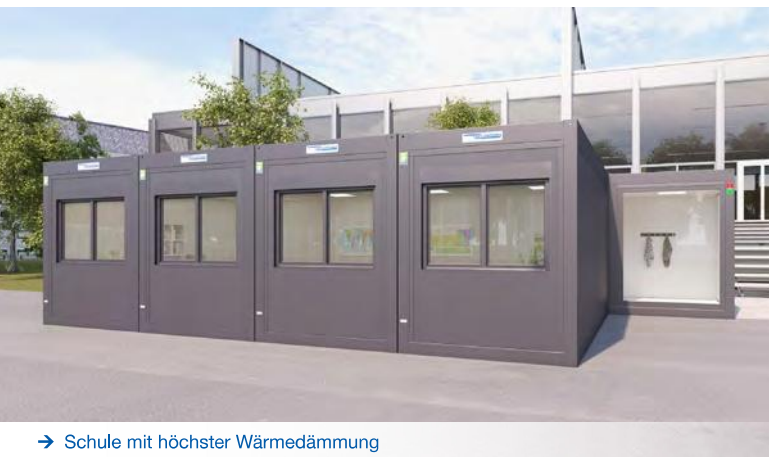
→ Schule mit höchster Wärmedämmung