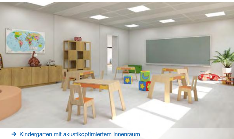
→ Kindergarten mit akustikoptimiertem Innenraum