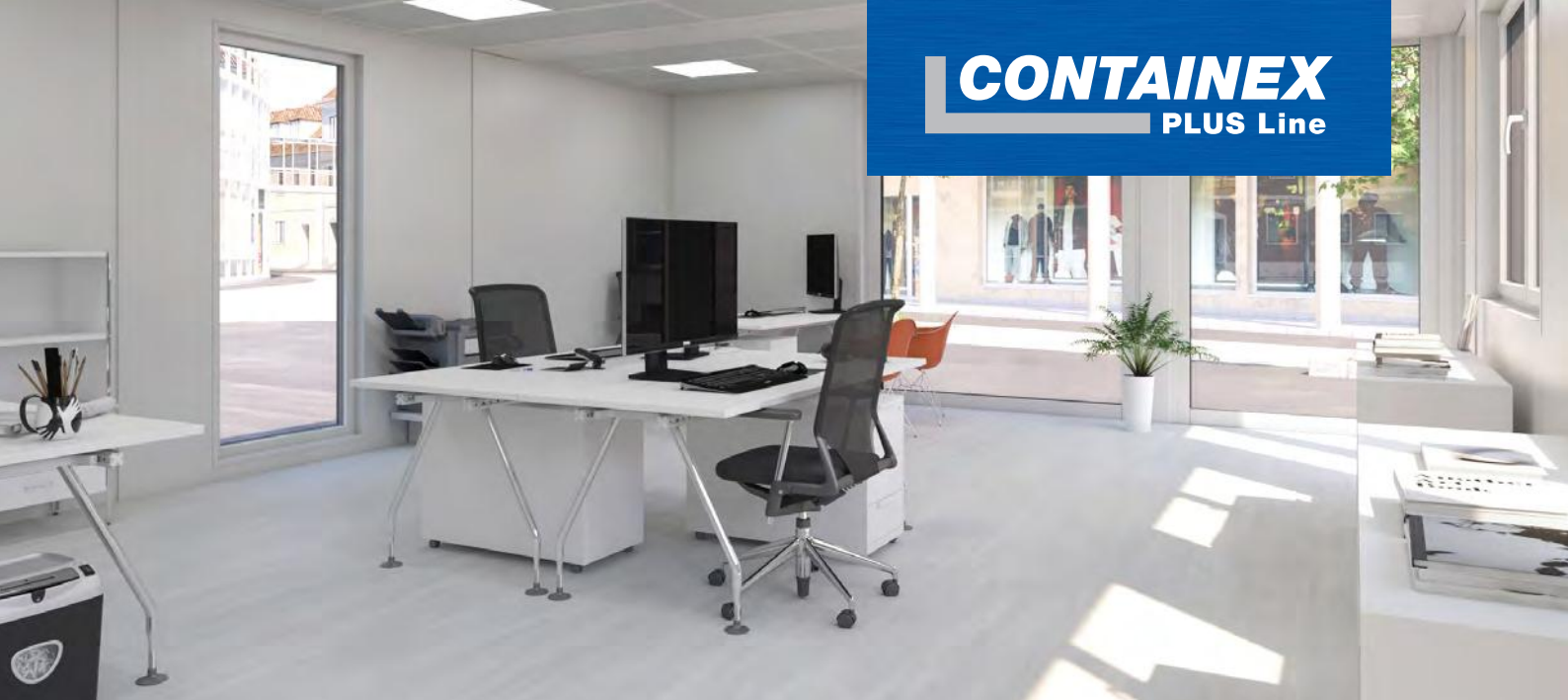
→ Attraktiver Bürountraum mit vielen Ausstattungsvarianten