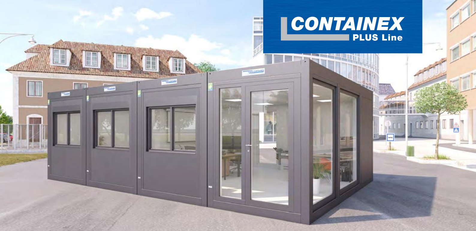
→ Büro im attraktiven Anthrazitgrau